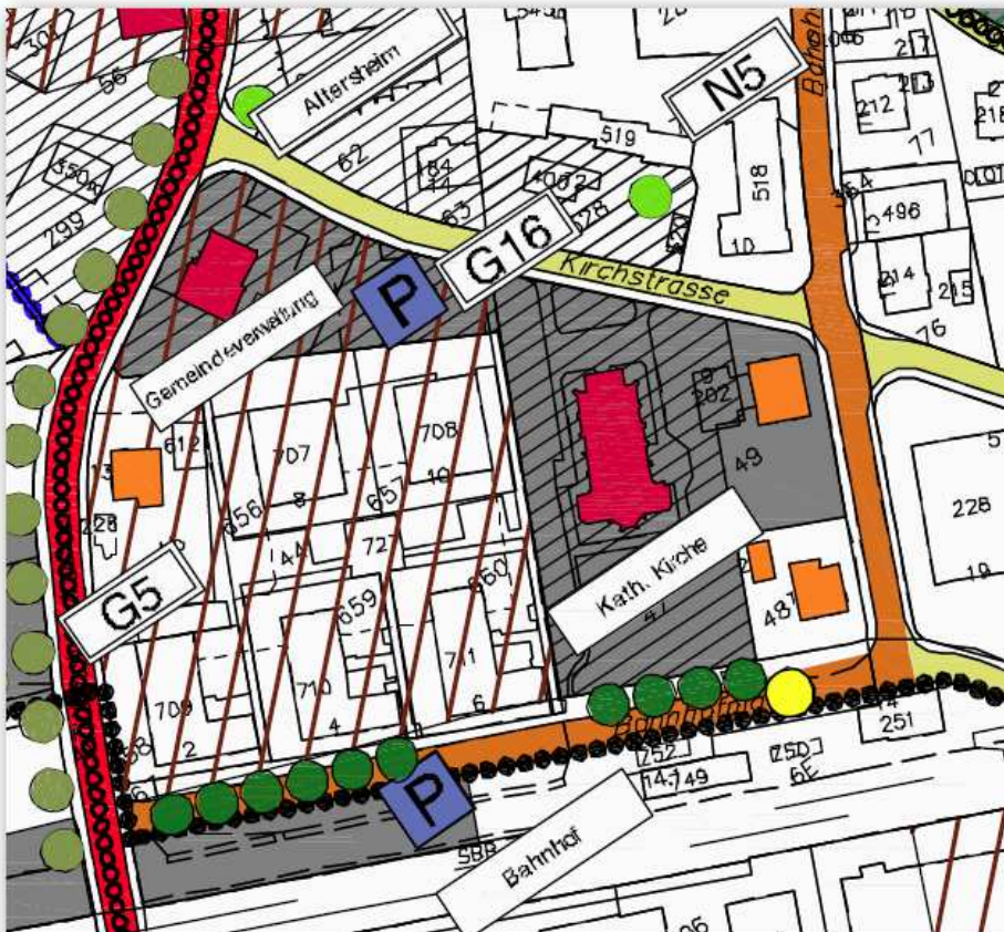
Auszug aus dem Gemeinderichtplan

Die Politische Gemeinde Horn hat ihre Ortsplanung anlässlich der Teilrevision 2009/2010 gesamthaft überprüft und zahlreiche Anpassungen vorgenommen. Unter dem Richtplaninhalt „Schutz und Gestaltung“, Richtplanabsicht G16 Aufwertung Kirchstrasse (West) hat sich der Gemeinderat unter anderem zum Ziel gesetzt, im Zusammenhang mit der Sanierung der katholischen Kirche und deren Umgebung die gestalterische Aufwertung der Kirchstrasse als öffentlichen Raum zu prüfen.