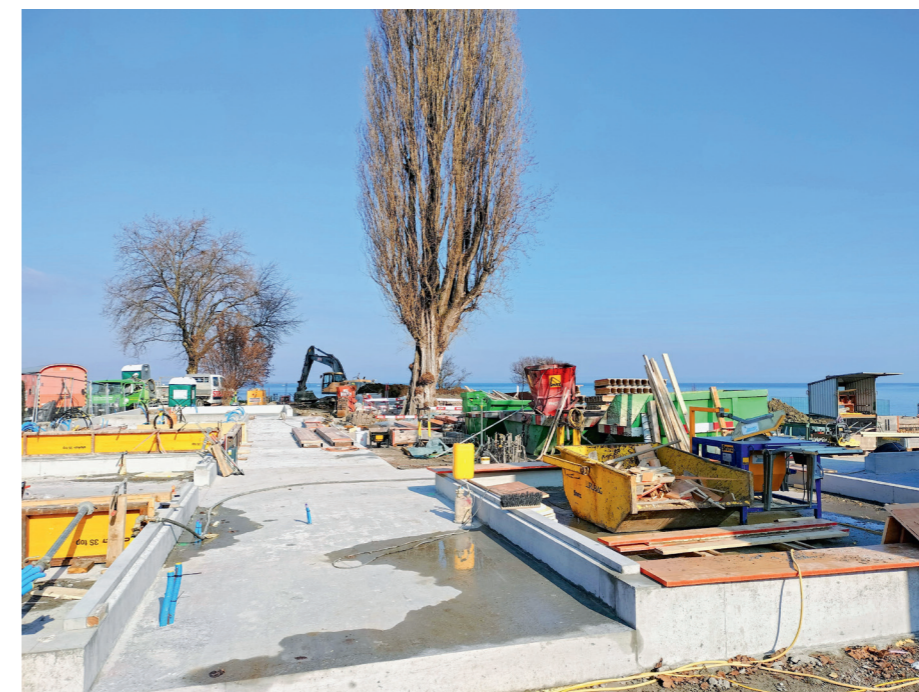
Auch für die neue Badi wurde die Baubewilligung im Jahr 2022 erteilt.