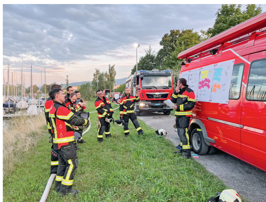
Angehörige der Feuerwehr bei einer Zugsübung im September 2022

Das Feuerwehrkommando dankt auf diesem Weg allen Feuerwehrkameraden für ihren Einsatz. Die Feuerwehr freut sich über neue Mitglieder. Interessierte dürfen sich gerne melden oder informieren sich am jährlich stattfindenden Anlass.