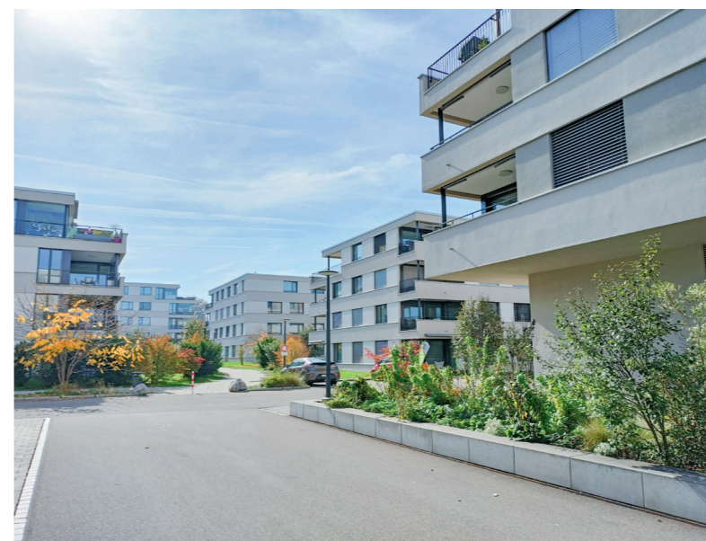
Überbauung Aurelia Horn West

Bei einem Bestand von insgesamt ca. 1'600 Wohnungen standen per Stichtag 01.06.2022 deren 11 leer (Vorjahr 32). Der Leerwohnungsbestand bewegt sich mit 0.7% unter dem kantonalen Mittel von 1.7%. Die gesamtschweizerische Leerwohnungsziffer lag am Stichtag bei 1.31%