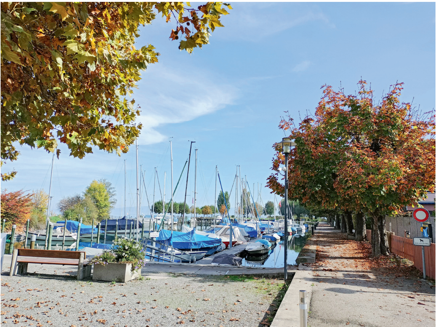
Hafen Horn Ost

Dienstag, 16. Mai 2023, anschliessend an die Versammlung der Volksschulgemeinde in der Mehrzweckhalle Horn, Feldstrasse 16